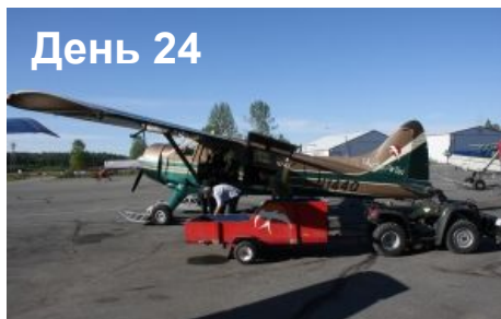
Возвращение в Анкоридж. Мы организуем групповой трансфер в Анкоридж. В неиспользованные резервные дни возможна организация рыбалки на королевского лосося, фото-охоты на медведя гризли и т. п.