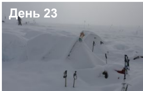
Резервный день на случай непогоды